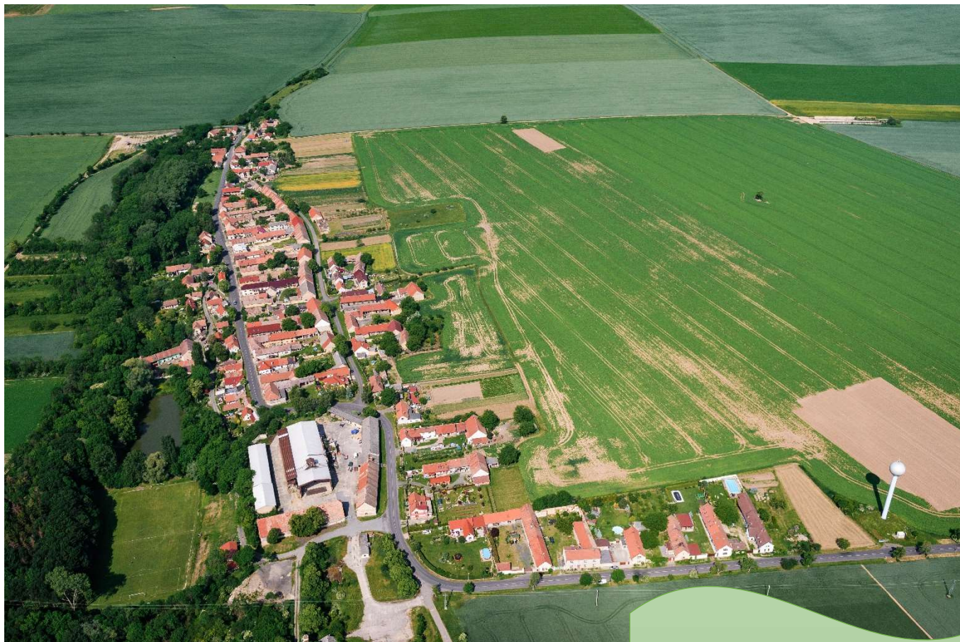
Podbradec – letecký snímek

www.msene-lazne.cz , info@msene-lazne.cz , tel. 416 865 351