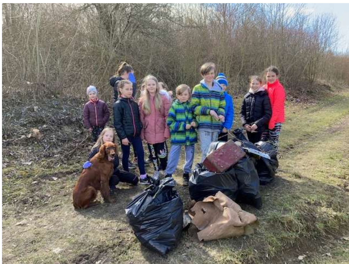
Děti z Vrbice